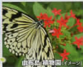
西表島 植物園(バニー)